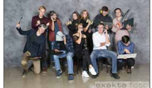
FF 2019/20 En ny mixerboard till Musikföreningen