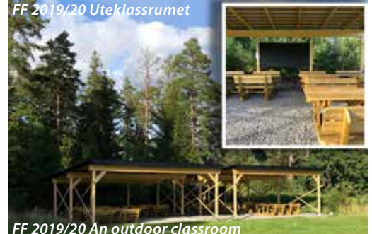
FF 2019/20 An outdoor classroom