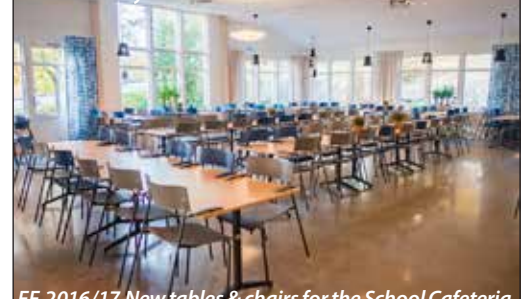
FF 2016/17 New tables & chairs for the School Cafeteria