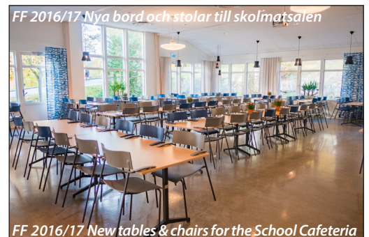
FF 2016/17 Nya bord och stolar till skolmatsalen