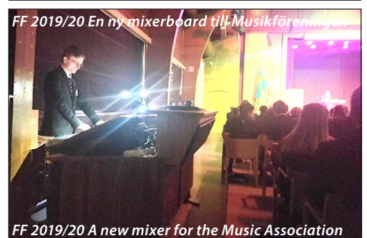
FF 2019/20 En ny mixerboard till Musikföreningen