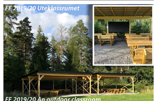
FF 2019/20 Uteklassrummet