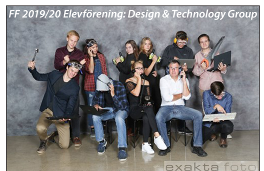
FF 2019/20 Elevförening: Design & Technology Group